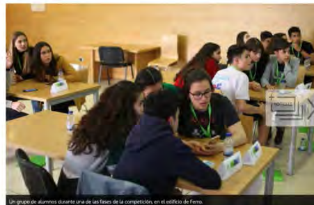
Un grupo de alumnos durante una de las fases de la competición, en el edificio de Ferro.

El Campus celebró la segunda Olimpiada Galega de Historia con 120 escolares de 4º de la ESO de toda Galicia, que demostraron sus conocimientos sobre la materia. El campeón se quedó en casa, en Celanova